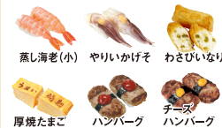
蒸し海老(小) やりいかげそ わさびいなり 厚焼たまご ハンバーグ チーズハンバーグ